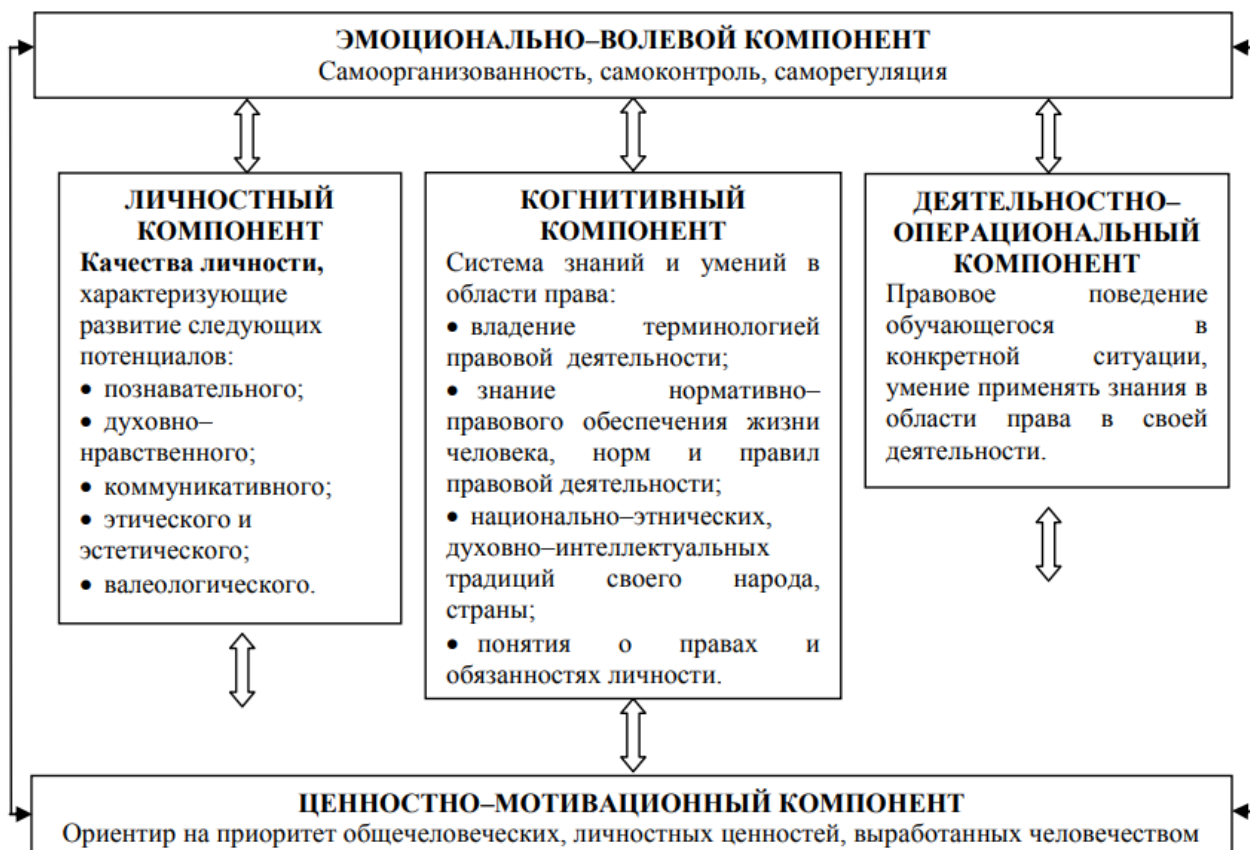
Рис. Структура правовой культуры обучающихся

Деятельностно - операциональный компонент отображает правовое поведение личности в конкретной ситуации, умение применять знания в области права в своей деятельности.