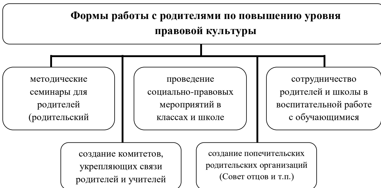
Схема. Формы работы с родителями по повышению уровня правовой культуры

В методических рекомендациях Научного центра правовой информации при Министерстве юстиции Российской Федерации определены основные результаты правового просвещения в родительской среде: