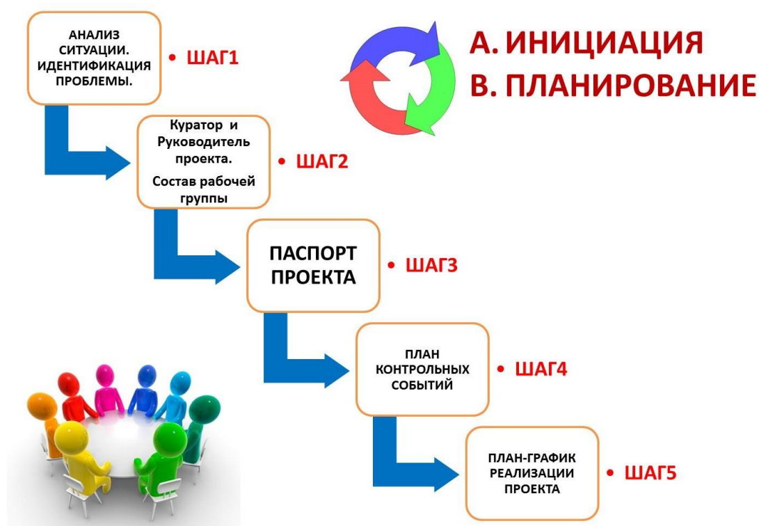
Схема 1. Алгоритм работы над управленческим проектом на этапах инициации и планирования

Шаг 5: Составление Плана-графика реализации проекта.