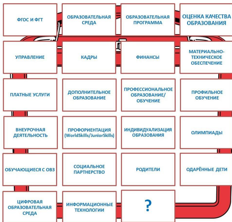
Рис.1. Направления деятельности образовательной организации

Кроме того, основанием для выявления проблем могут стать: