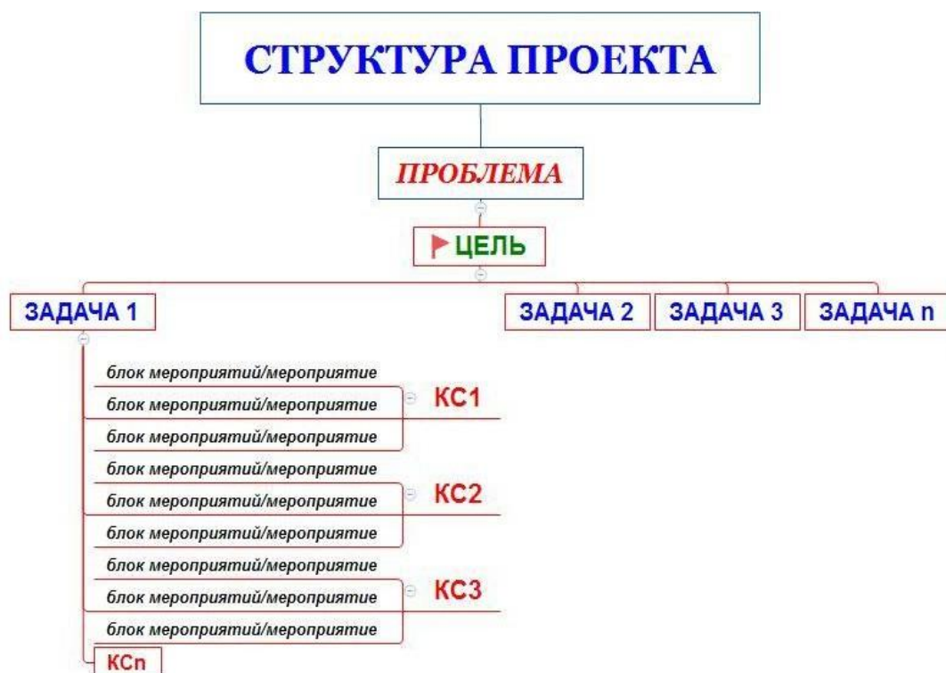
Схема 2. Упрощённая структура управленческого проекта

Упрощённую структуру управленческого проекта можно представить в виде схемы: