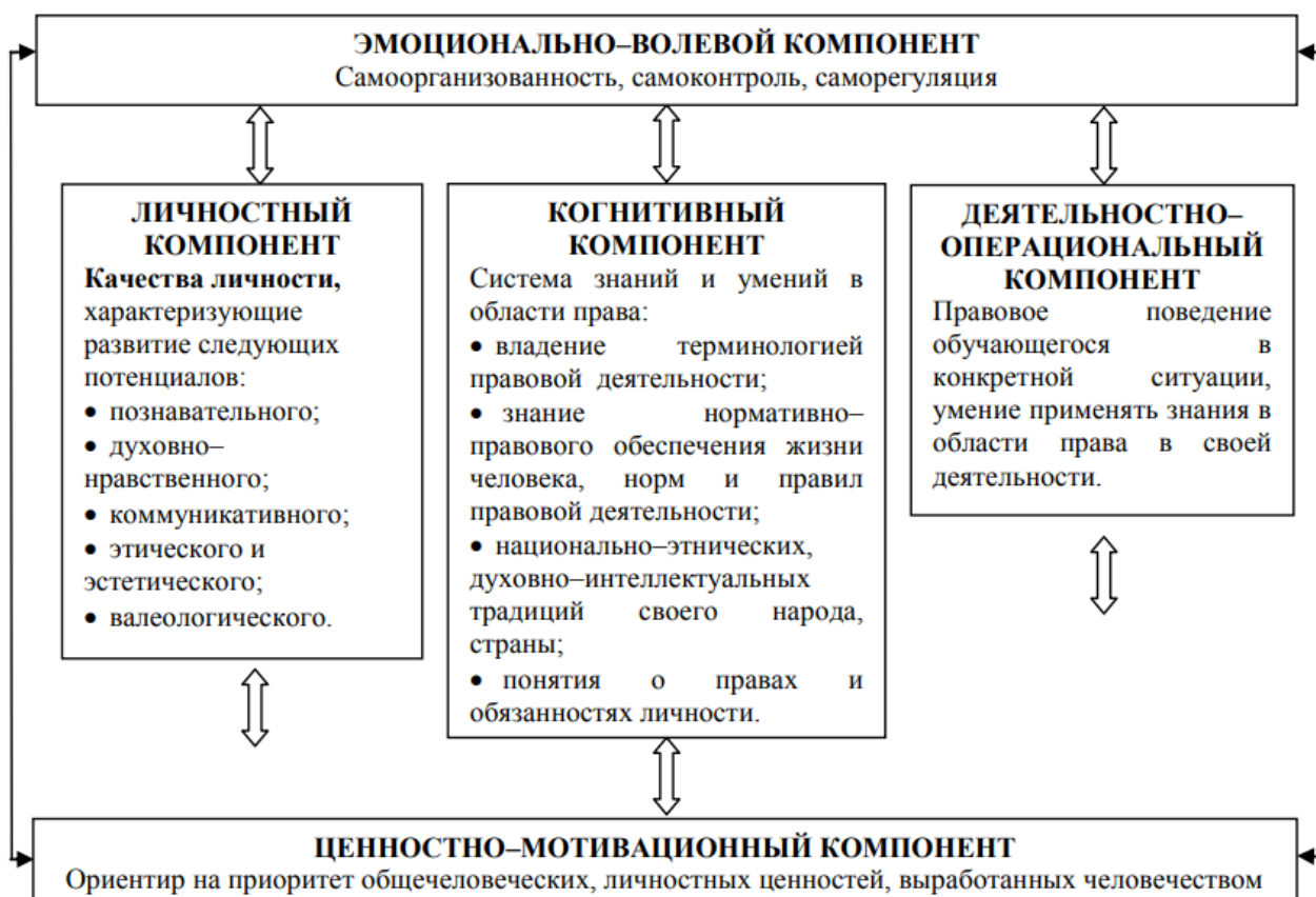
Рис. Структура правовой культуры обучающихся

Деятельностно - операциональный компонент отображает правовое поведение личности в конкретной ситуации, умение применять знания в области права в своей деятельности.